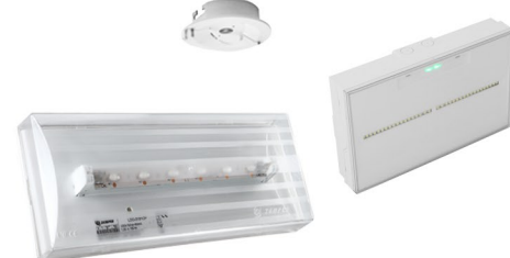
Exemple LSC ANTI-PANIQUE